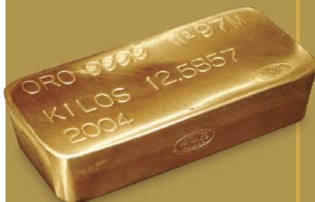
Lingote de 12.5 kg (400 TOZ Ingot)