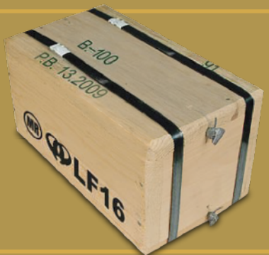
Caja de madera (Wooden box)