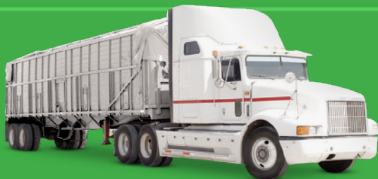
Granel en camión de caja (Bulk in box truck)