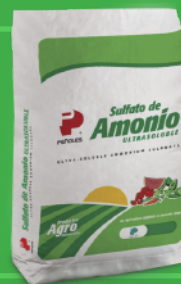
Saco de rafia cosido de 25 kg y 50 kg (55 lb and 110 lb stitched shredded bag)