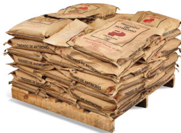
Tarima de 1000 kg (2205 lb Pallet)