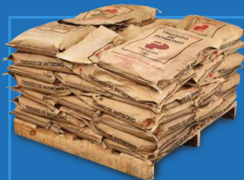
Tarima de 1000 kg (2205 lb Pallet)