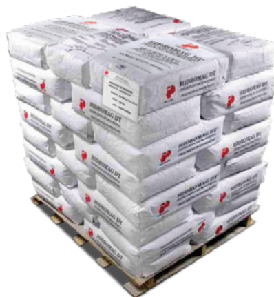
Tarima de 1000 kg (2205 lb Pallet)