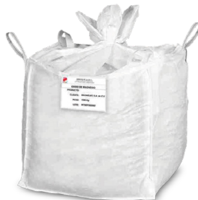
Supersaco de 750 kg (1653 lb Big bag) y 1 Tm (2205 lb big bag)