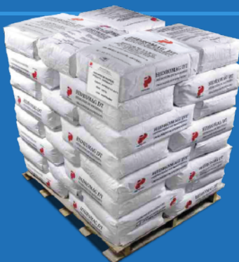
Tarima de 1000 kg (2205 lb Pallet)