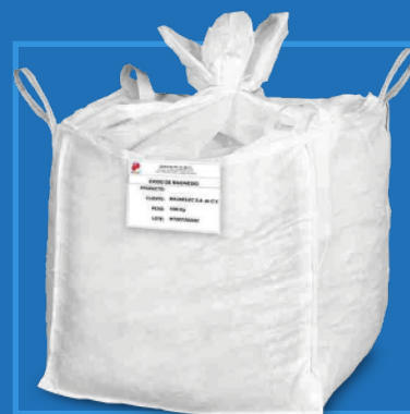
Supersaco de 750 kg (1653 lb Big bag) y 1 Tm (2205 lb big bag)