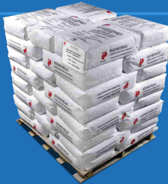
Tarima de 1000 kg (2205 lb Pallet)