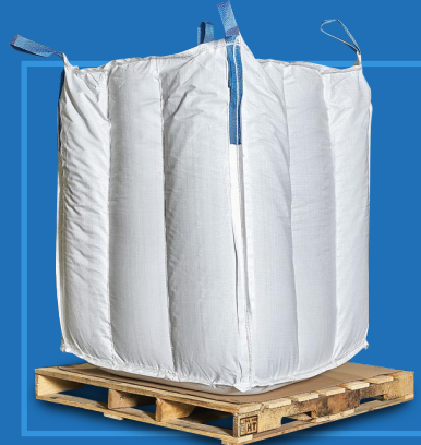
Supersaco de 750 kg (1653 lb Big bag)