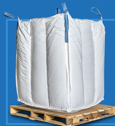
Supersaco de 750 kg (1653 lb Big bag)