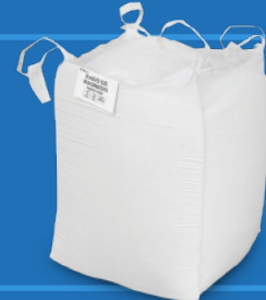
Supersaco de 750 kg. (1,653 lb. Big bag)