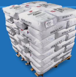
Tarima de 750 y 1,500 kg. (1,653 and 3,306 lb. pallet)