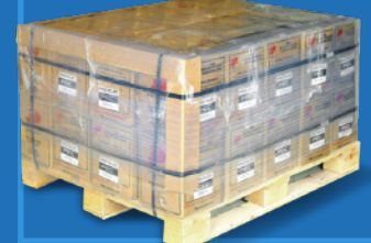
Tarima con cajas de 1,000 kg. (2205 lb. boxes pallet)