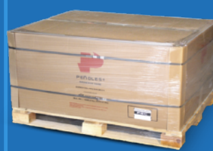
Tarima de 1000 kg. (2205 lb. pallet)