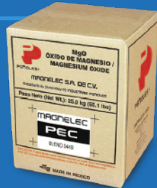
Caja de 25 kg. (55 lb. cardboard box)